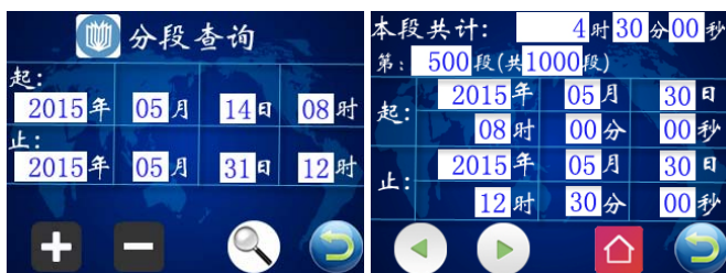
图六 查询条件界面