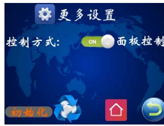
图九 更多设置页面