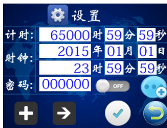
图八 参数设置页面