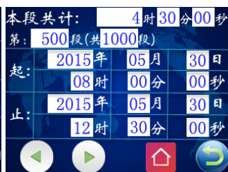
图七 查询结果页面