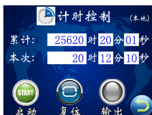
图三 计时控制界面